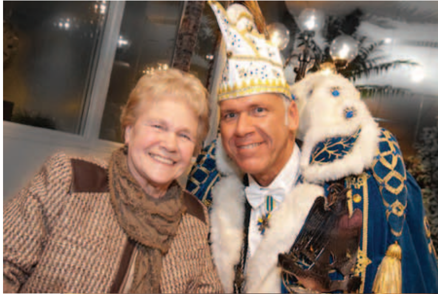
Foto- impressie Prinsen- feest 2012