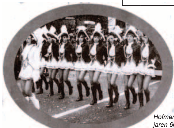
Hofmarjannekes jaren 60